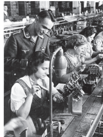
Abb. 6 Propagandabild, das den Besuch eines Soldaten bei seiner zur kriegswichtigen Arbeit dienstverpflichteten Frau darstellen soll.

berufstätigen Frauen reichsweit um fast 300.000 zurück, 99 im Wehrkreis VII sank sie um rund 15.000. 100 In Augsburg bezogen im Jahr 1942 rund 8.500 Einzelpersonen und Familien Unterstützung über das zu Kriegsbeginn bei der Stadt eingerichtete Amt für Familienunterhalt. Obwohl auch hier offenbar häufiger Versuche, den Familienunterhalt auszunutzen, vorkamen, verzichtete das Amt anscheinend weitestgehend auf Repressions- oder Zwangsmaßnahmen. 101