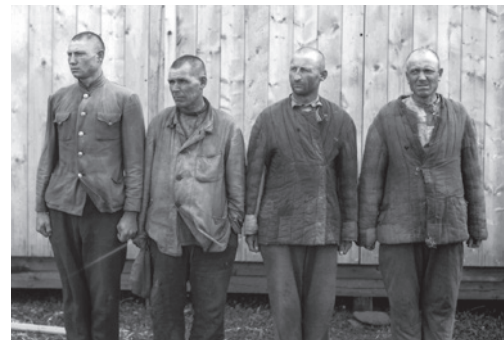
Abb. 7 Sowjetische Kriegsgefangene, die für die Reichsbahndirektion Augsburg Zwangsarbeit leisten mussten.

an Freiwilligen vor allem Zwangsmaßnahmen bei der Anwerbung zum Tragen kamen. Anfänglich ungenutzt blieb aufgrund von ideologischen Vorbehalten, Sicherheitsbedenken und der aus den bisherigen Kriegserfolgen resultierenden Hybris das Arbeitspotenzial der Kriegsgefangenen aus der Sowjetunion. Erst im Oktober 1941 erlaubte der Führer die Verwendung der sowjetischen Gefangenen für die Kriegswirtschaft (Abb. 7). 134 Allerdings waren von den anfänglich 3,9 Mio. im Februar 1942 bereits 2,8 Mio. durch Hunger, Seuchen und die allgemein schlechte Behandlung gestorben oder nicht mehr einsetzbar.