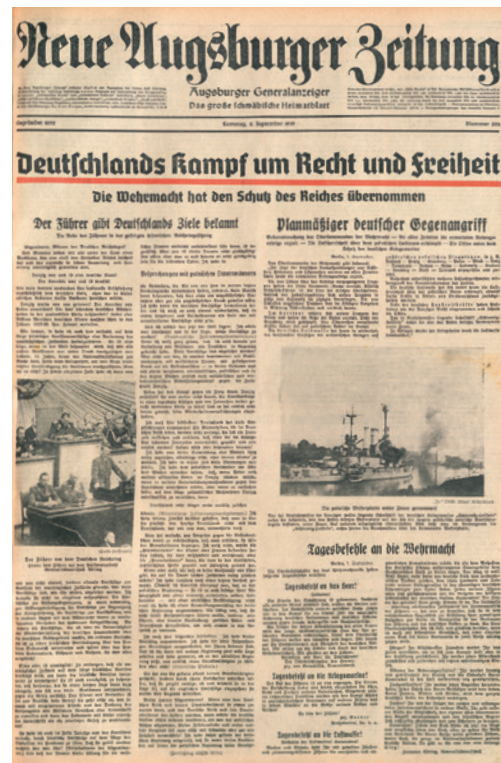
Abb. 31 Titelblatt der Neuen Augsburgischen Zeitung vom 2. September 1939. So wurde der Bevölkerung der Kriegsbeginn vermittelt.