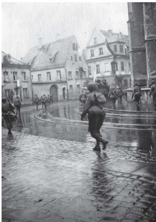
Abb. 34 Amerikanische Truppen marschieren am Morgen des 28. April 1945 in Augsburg ein. Das Bild zeigt die Soldaten, als sie den Ostchor des Domes passieren (Frauentorstraße).