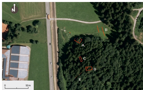
43 Planskizze der sichtbaren Fundamentreste A–E des KZ-Außenlagers auf einer aktuellen Luftaufnahme. Von Gebäude C ist die gesamte Bodenplatte mit Abflussrohren erhalten.