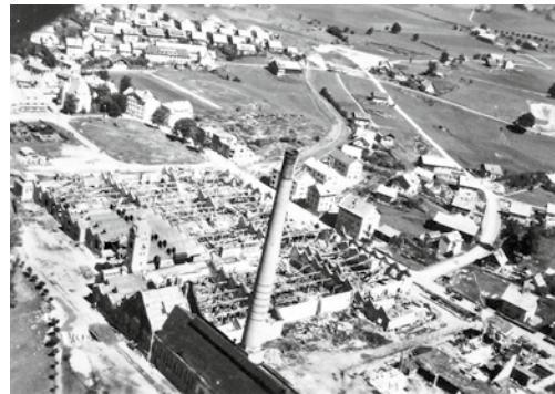
9 Aufnahme einige Zeit nach dem Luftangriff vom 19. Juli 1944. In der rechten unteren Bildecke liegt einer der Bereiche der Fabrik, in denen weiter für Messerschmitt produziert wurde und auch KZ-Häftlinge eingesetzt waren. An der Straße ist ein Wachturm (vgl. Abb. 4) und daneben ein Teil der Umzäunung erkennbar.

Messerschmitt AG mit ihren Zweigwerken ganz oben auf der Liste des Rüstungskommandos Augsburg von zu verlagernden Betrieben. 10