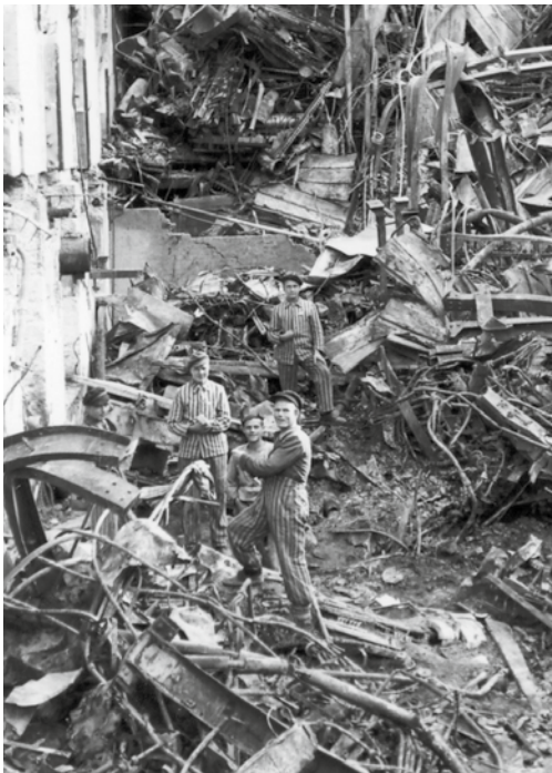
8 KZ-Häftlinge in den Trümmern des südlichen Hochhauses der Spinnerei und Weberei Kottorn an der Iller, in welchem bis zu dem Luftangriff auch teilweise für Messerschmitt/Werkzeugbau Kottorn gefertigt wurde.