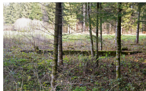
46 Grundmauern der Häftlingsbaracke (A); auf der Wiese im Hintergrund stand die Wachmannschaftsbaracke (B).