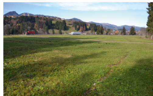
45 Reste der Grundmauern der Wachmannschaftsbaracke (B) des KZ-Außenlagers Fischen an der heutigen B 19; im Hintergrund Fischen-Maderhalm und Fischen-Berg.