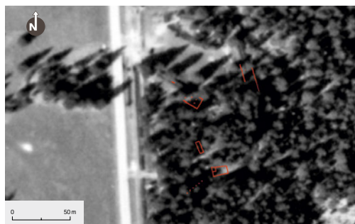
44 Planskizze der heute noch sichtbaren Fundamentreste des KZ-Außenlagers auf einer Luftaufnahme vom April 1945 (Ausschnitt aus Abb. 42). Teilweise sind die Dächer der Baracken zu erkennen.