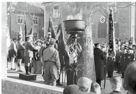
25 | Gedenkfeier am Friedberger Kriegendenkmal.

fehlenden Männer in verschiedenen Lebensbereichen zu ersetzen.