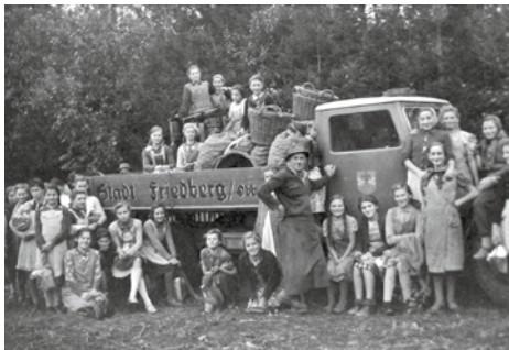
30 | Friedberger Mädchenklasse bei der Karnevalfeier, 1940.

Friedberger Kinder mussten sich an der Kartoffelernte beteiligen. Die Mädchenvolksschule Friedberg betätigte sich seit 1942 im „Schul-seidenbau“, das heißt der Produktion von Seide für kriegswichtige Materialien wie Fallschirme. 1944 erhielt die Schule deswegen eine Prämie von 10 Reichsmark für ihre hervorragenden