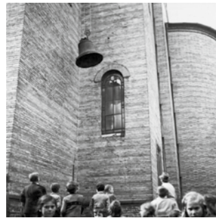
32 | Während des Kriegs wurden bronzeene Kirchenglocken als kriegswichtiges Material beschlagnahmt und für die Verwendung in der Rüstungsindustrie eingeschmolzen. 1942 kam es zur Abnahme der Glocken von St. Jakob in Friedberg, St. Stephan in Wiffrathausen und in der Wallfahrtskirche Herrgottsrud.