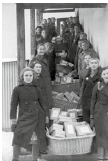
31 | Sammelaktion für Soldaten zu Weihnachten.

Während des Kriegs waren Lebensmittel und Kleidung rationiert und nur auf Bezugsschein erhältlich. Die Bevölkerung wurde zum ständigen Sparen im Interesse der Kriegswirtschaft aufgefordert. Auch im schwäbischen Raum fand Anfang 1945 die Spendenaktion „Volkspoker für Wehrmacht und Volksturm“ zur Sammlung von Ausrüstungsgegenständen und Bekleidung statt. Im Zuge der „Metallspende“ wurden besonders Kirchenglocken systematisch erfasst und zur Einschmelzung für Kriegszwecke demontiert. In der Gemeinde Friedberg betraf dies die Pfarrkirche St. Jakob, St. Stephan in Wiffrathausen und die Wallfahrtskirche Herrgottsrud. Stadtpfarrer Alois Brugger berichtete am 12. Mai 1942 an das Bischöfliche Ordinariat in Augsburg über die Abnahme: „[...] es ging alles ruhig u. schnell vor sich. Den Kindern war es ein gaudium; von den Erwachsenen wurde manch' bittere Aeusserung gemacht; auch Thränen sah ich. [...] Um