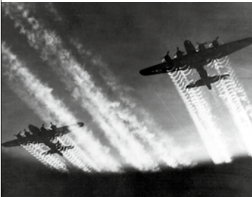
16 | Die Boeing B-17 Flying Fortress zählt zu den bekanntesten Bombern der US-Luftstreitkräfte im Zweiten Weltkrieg. Hier bei einem Angriff über Osteuropa.

Hauptleidtragende der Luftangriffe war die Zivilbevölkerung, für die es im Deutschen Reich keine bombensicheren Luftschutzbunker in ausreichender Anzahl gab. Viele Menschen mussten in Kellern und Katakomben Schutz suchen oder kamen im Freien ungeschützt zu Tode. Der Luftkrieg bestimmte den Kriegsaltag der Bevölke-