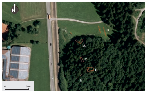
43 Planskizze der sichtbaren Fundamentreste A-E des KZ-Außenlagers auf einer aktuellen Luftaufnahme. Von Gebäude C ist die gesamte Bodenplatte mit Abflussrohren erhalten.