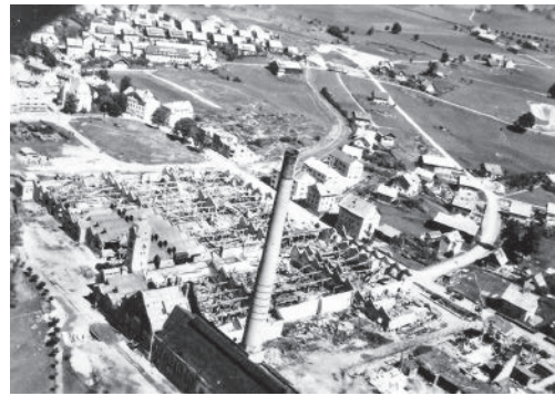
9 Aufnahme einige Zeit nach dem Luftangriff vom 19. Juli 1944. In der rechten unteren Bildecke liegt einer der Bereiche der Fabrik, in denen weiter für Messerschmitt produziert wurde und auch KZ-Häftlinge eingesetzt waren. An der Straße ist ein Wachturm (vgl. Abb. 4) und daneben ein Teil der Umzäunung erkennbar.

Messerschmitt AG mit ihren Zweigwerken ganz oben auf der Liste des Rüstungskommandos Augsburg von zu verlagernden Betrieben. 10