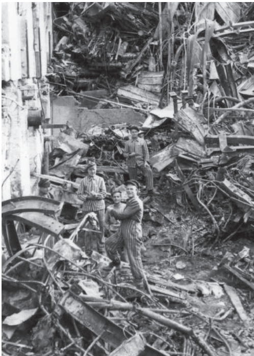
8 KZ-Häftlinge in den Trümmern des südlichen Hochhauses der Spinnerei und Weberei Kottner an der Iller, in welchem bis zu dem Luftangriff auch teilweise für Messerschmitt/Werkzeugbau Kottner gefertigt wurde.