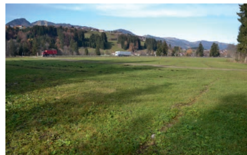
45 Reste der Grundmauern der Wachmannschaftsbaracke (B) des KZ-Außenlagers Fischen an der heutigen B 19; im Hintergrund Fischen-Maderhalm und Fischen-Berg.