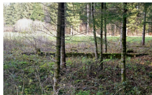
46 Grundmauern der Häftlingsbaracke (A); auf der Wiese im Hintergrund stand die Wachmannschaftsbaracke (B).