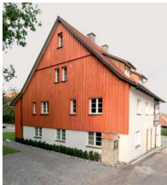
Mit der Sanierung erhielt das Haus einen Bretter-schirm an der Westseite.

Sommer 1723 gefällt wurden. Dieser Befund passt auch sehr gut zur stilistischen Einordnung der Bauformen. Beide Gebäude stehen am Rand der Stiftsstadt. An den Hanggrundstücken führt der Fahrweg auf den Reichelsberg vorbei. Der alte Flurname ist Auf dem oberen Schleien , was sich auf den Schleienweiher bezieht, ein Fischgewässer in der Stiftsstadt. Auch die beiden Häuser in der Milchgasse waren in Herbergen unterteilt, die – nicht nur, wenn sie in den oberen Stockwerken lagen – über eigene Zugänge verfügten. In den Häuserbögen, die in diesem Fall bis 1778 zurückreichen, zeigt sich das in einer Vielzahl von Personen als Besitzern, deren Berufe nur selten angegeben sind: Für die Milchgasse 4 sind ein Maurer und ein Zimmermann genannt. Zu die-