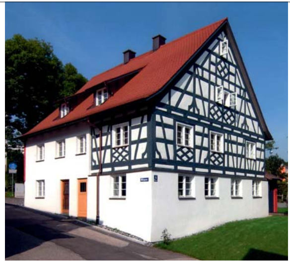
Das Gebäude mit dem für Kempten ungewöhnlichen Sichtfachwerk ist um 1723/24 errichtet worden und steht am Rande der Stiftsstadt.

Kempten eher untypischen Sichtfachwerk vom Bautyp sehr ähnlich und müssen fast zeitgleich entstanden sein. Bei der Sanierung vom Haus Milchgasse 1 im Jahr 2000 wurden einige dendrochronologische Proben entnommen, die ein sehr homogenes Bild ergaben: Sieben Proben stammen von Bäumen, die im Winter 1722/23 oder im