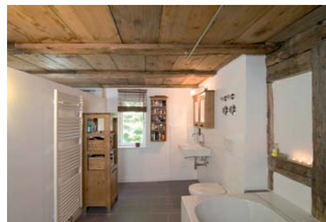
Eine reduzierte Einrichtung lässt den Blick auf die historischen Elemente wie den Fachwerkbalken und die Holbocken frei.