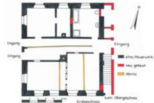
Vor seiner Sanierung befand sich das Gebäude in einem desolaten Zustand. Die zwei Eingänge deuten darauf hin, dass das Haus einmal als Herberge diente.

Kempten eher untypischen Sichtfachwerk vom Bautyp sehr ähnlich und müssen fast zeitgleich entstanden sein. Bei der Sanierung vom Haus Milchgasse 1 im Jahr 2000 wurden einige dendrochronologische Proben entnommen, die ein sehr homogenes Bild ergaben: Sieben Proben stammen von Bäumen, die im Winter 1722/23 oder im