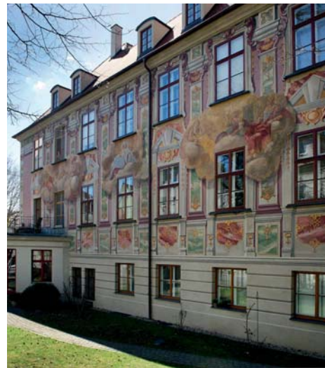
Die prächtig bemalte Ostfassade des Kathanhau aus der zweiten Hälfte des 16. Jahrhunderts nach der Restaurierung. Möglicherweise gestaltete Johann Baptist Bergmüller die Fassade. Zwischen dem ersten und zweiten Stockwerk sind verschiedene Heilige auf Wolken lagern dargestellt.

Stadt, also im Wohn- und Handelsviertel der Oberschicht. Später ist die Fassadenmalerei eine stadtwide Erscheinung. Für die erste Hälfte des 18. Jahrhunderts gilt Johann Georg Bergmüller (1688–1762) als einer der bekanntesten Maler der