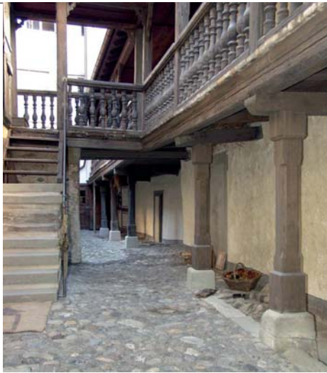
Dieses Bild zeigt den Laubengang von Norden in Richtung Wohnhaus.