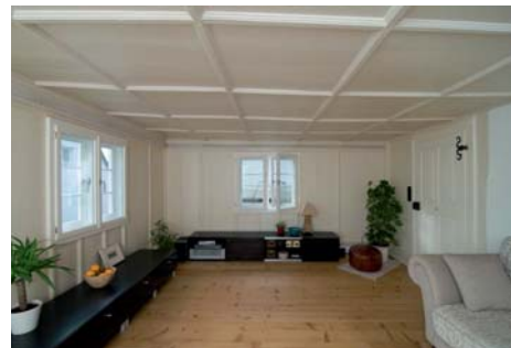
Die alten Fenster, Türen, Holbocken und Wandlisen wurden sorgsam restauriert.

Die Wohnung im Erdgeschoss kann durch zwei direkt nebeneinander liegende Eingänge von der